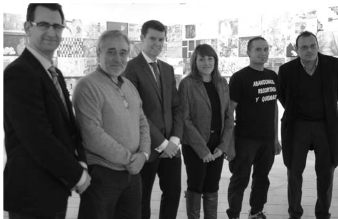
Foto: Ponentes Charla Club Diario Levante