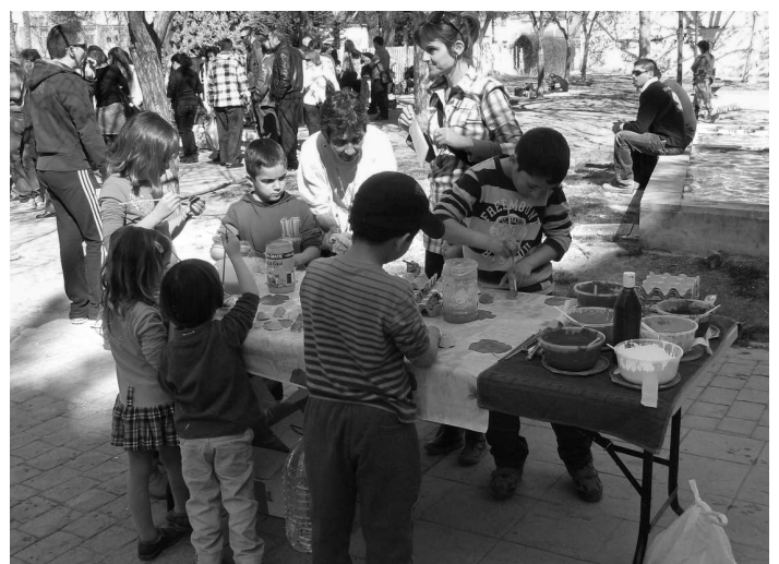
Taller durante un mercado de trueque.

Parece que estamos despertando a nuevas formas de vida. Alternativas a un sistema que estando en crisis se refuerza a sí mismo a costa del pueblo que lo sostiene.